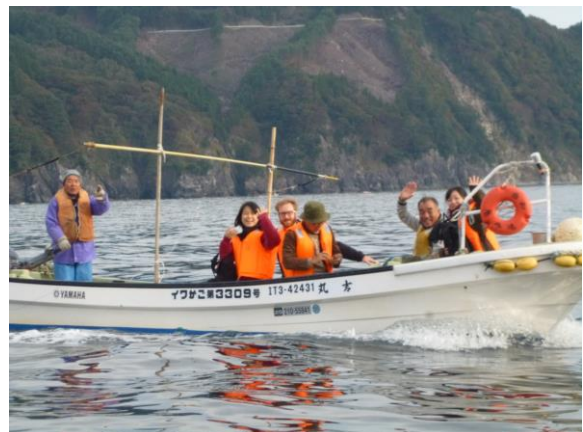
早朝の唐丹湾内クルージング