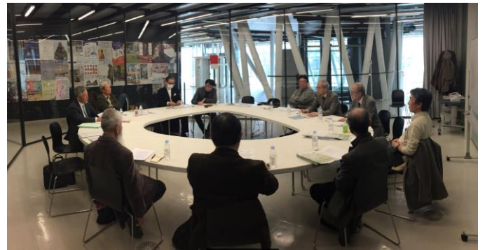
事前打ち合わせの様子(せんだいメディアテーク4階)