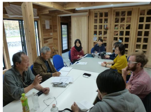
まとめの討論の様子(第2日目)