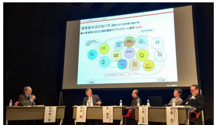
会場の様子(せんだいメディアテーク 1F オープンスクエア)