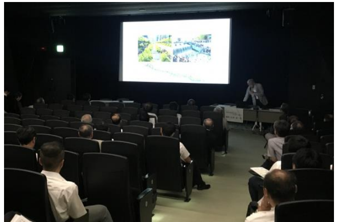
会場の様子(せんだいメディアテークスタジオシアター)

終わりに、12月5日AW2017で、「これからの建築とまちづくり PART3」開催を確認した。途中、和田政宗参議院議員も会場に駆けつけて頂き、参加者約100名、大いに盛り上がったシンポジウムであった。その後の懇親会では土井議員、和田議員を交え、基本法の必要性や実現に向けて議論を交わした。